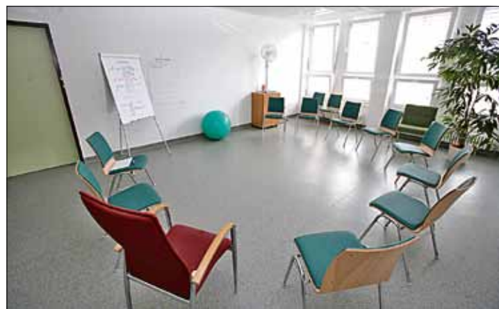
Raum für Gruppentherapie

Oft werden diese psychosomatischen Erkrankungen, die auf einer Wechselwirkung von körperlichen und seelischen Ursachen beruhen, nicht rechtzeitig erkannt und fachgerecht therapiert, weil sich die Betroffenen nicht immer ihrem