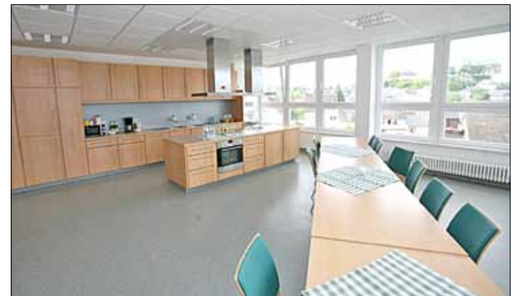
Gemeinschaftsküche und Aufenthaltsraum

terbehandelt. Diesen Part der Rehabilitation übernehmen die AHG-Kliniken Daun. Wichtig ist, dass die Patienten während des Krankenhausaufenthaltes stabilisiert werden und – ganz wichtig! – ihr Gefühl der Isolierung überwinden. Das geschieht überwiegend