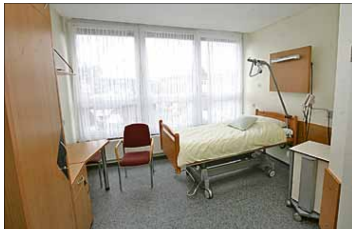
Komfortable Ein- und Zweibettzimmer stehen zur Verfügung

Projekt mit Modellcharakter Im Dauner Krankenhaus Maria Hilf können seit dreieinhalb Jahren Patienten in einer Fachabteilung sehr gut behandelt werden, die an einer akuten psychosomatischen Erkrankung leiden. Zustände gekommen ist die Fachabteilung aufgrund gemeinsamer Initiative der AHG Kliniken Daun und dem Krankenhaus Maria Hilf in Daun. Die Idee beider Einrichtungen gab es schon viel früher. Für die Realisierung mussten im Vorfeld ausreichende Mittel beantragt werden. Das Besondere an dieser Kooperation ist die unterschiedliche Ausrichtung beider Träger. Das Krankenhaus hat einen kirchlichen Träger, während die AHG-Kliniken