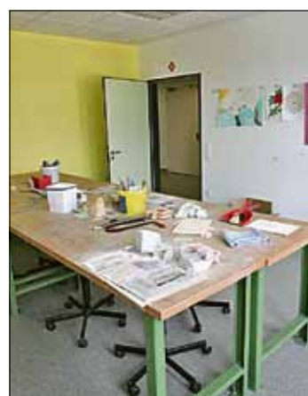
Werkraum für die Kreativtherapie

der Aufnahme erfolgt eine ausführliche medizinische und psychologische Diagnostik, die individuell auf die Vorgeschichte und Bedürfnisse jedes einzelnen Patienten abgestimmt ist.